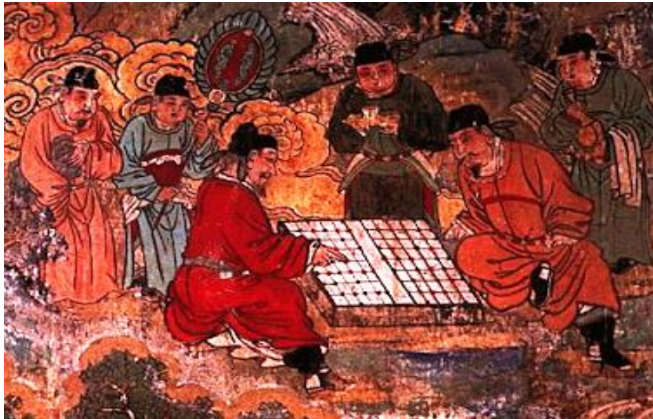
Mural del Templo De Lage Guangsheng, 1319.

Una quinta hipótesis sobre el origen del ajedrez, está basada en investigaciones recientes que indican un posible origen chino; ubicado en la región entre Uzbekistán y la antigua Persia, que se podría remontar hasta el siglo III a.C.